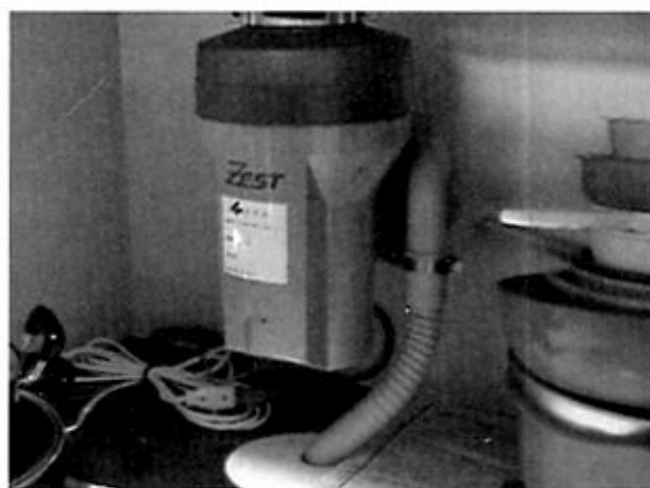
写真-2 宅内設置状況