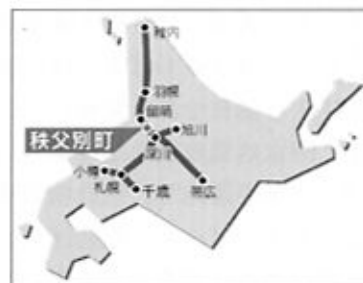
図-1 秩父別町の位置